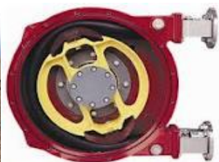
Fig 1: Simple Hose Pump Construction