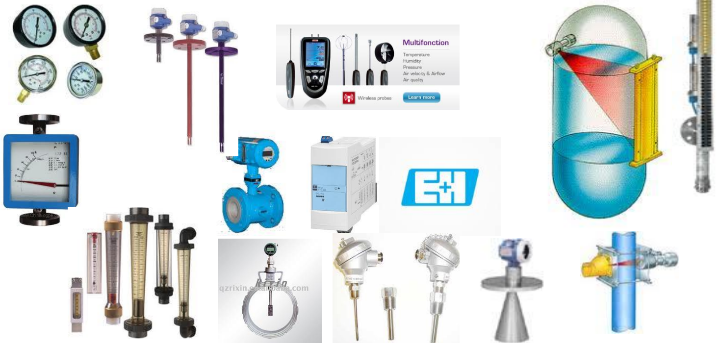
ABB- Siemens – Fisher – Rosemount- Emerson – Kobold

انواع ابزار دقیق: اعم از لول مترها و دانسیته مترها، پرشر سویچ ها و... محصول شرکت E+H و سایر برندهای معتبر